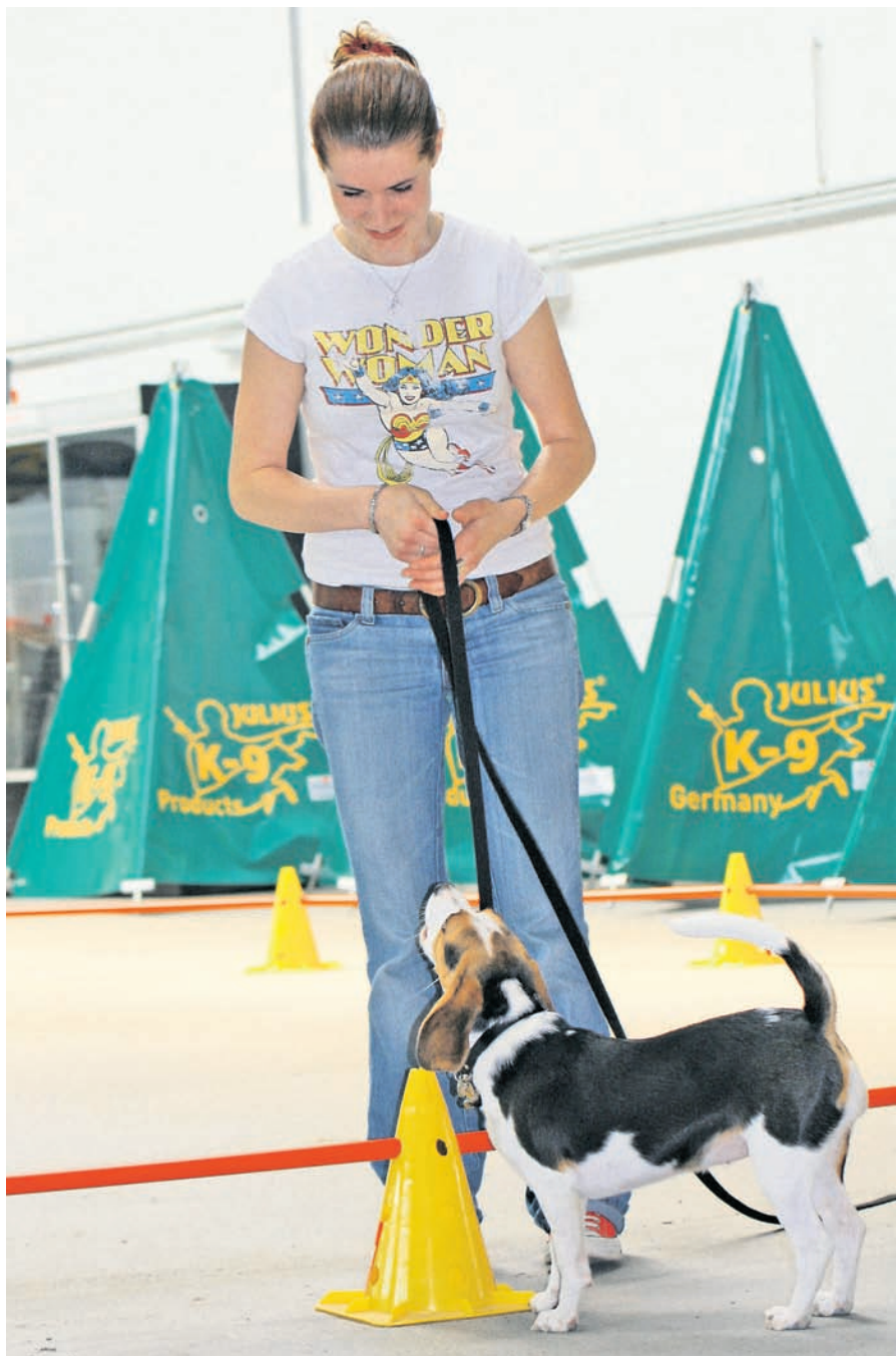
Das Longieren zeichnet sich durch einen hohen kommunikativen Charakter aus und ist sowohl ein hervorragendes Auslastungsmodell als auch ein Stück wert-volle Beziehungsarbeit.

Auffallend ist, dass viele Hundehalter auf dem Hundeplatz oder draussen sehr konsequent im Umgang mit ihrem Hund sind, drinnen im Haus aber nicht.