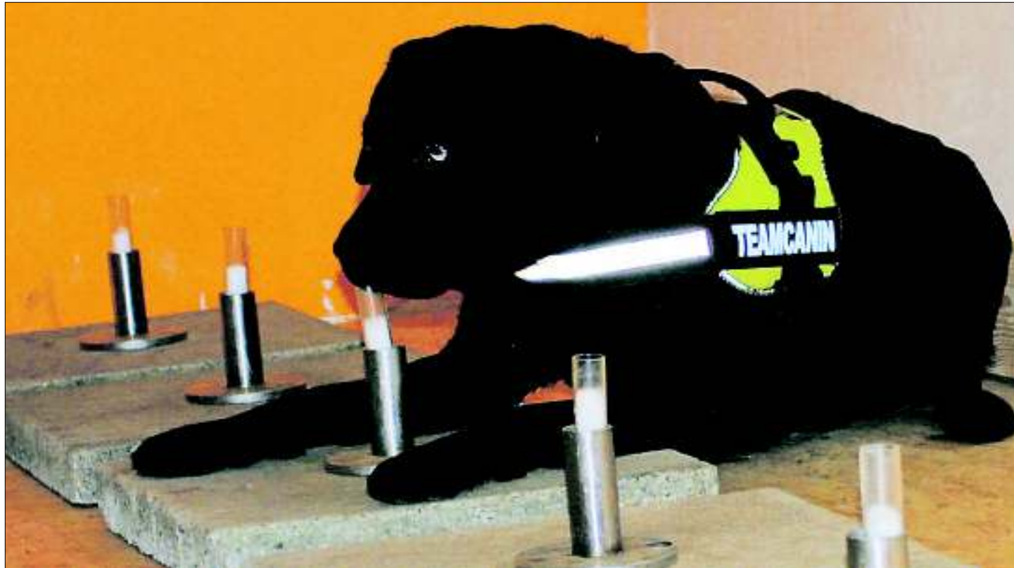
Wenn Hektor die Atemluftprobe eines Patienten mit Lungenkrebs unter die Nase kommt, legt er sich vor das Röhrchen