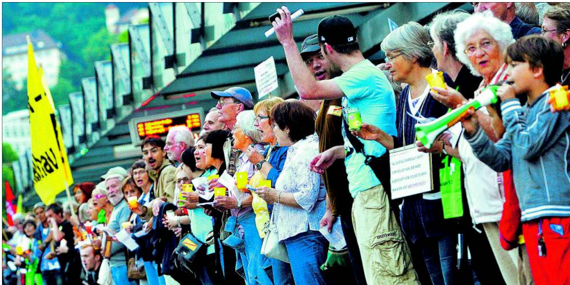
Mit brennenden Kerzen stehen Menschen am Freitagabend in Stuttgart vor dem Hauptbahnhof und demonstrieren friedlich gegen das Bahnprojekt Stuttgart 21. Über 18 000 Teilnehmer umschlossen Hand in Hand Teile des Kopfbahnhofs und des Mittleren Schlossgartens. Am Freitagmorgen hatte die Bahn begonnen, den Nordflügel des Bonatz-Baus mit einem Bagger abzubauen.